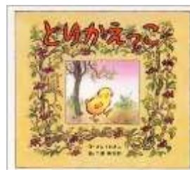
太陽 (3 歳)