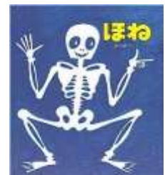
太陽 (4・5 歳)