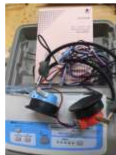
聴力検査用オージオメーター