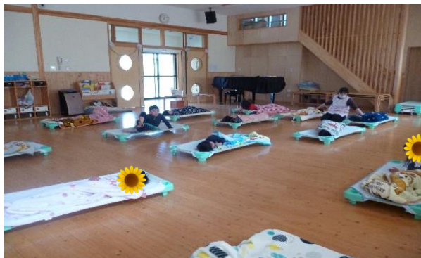
お昼寝の間隔をあけて・・・