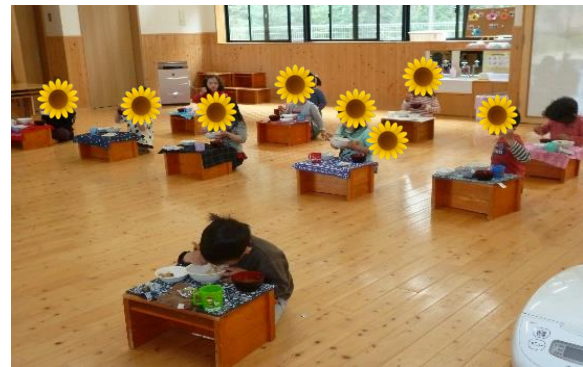
お食事も横並びで・・・