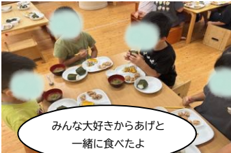
みんな大好きからあげと一緒に食べたよ