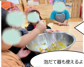
泡だて器も使えるよ

5歳で、おにぎりを作りました。各自好きな具を選んで、握りました。具材も上手に包め、のりもきれいに巻けていました。