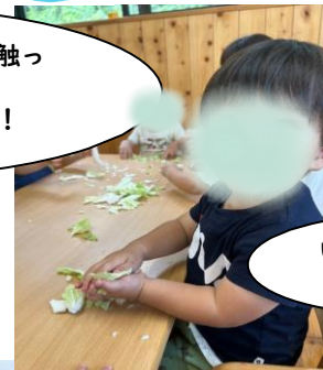
いっぱいちぎってぎゅー！