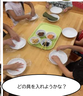
どの具を入れようかな？