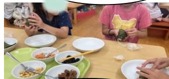
握ったらのりを巻きます

5歳で、おにぎりを作りました。各自好きな具を選んで、握りました。具材も上手に包め、のりもきれいに巻けていました。