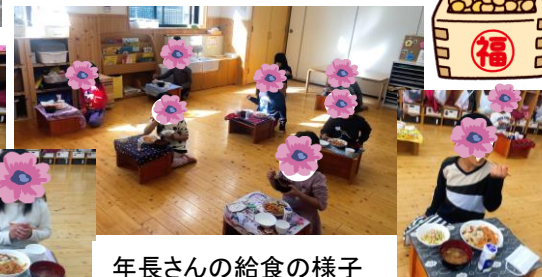
年長さんの給食の様子