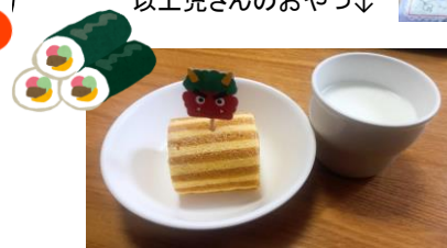
おやつは、恵方巻をイメージしてロールケーキでした。