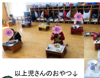
以上見さんのおやつ↓